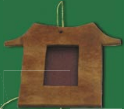
vi0-20-115 Mini-Bilderrahmen aus duftender Zimtrinde „Pagode“ 8 x 10 cm 4,50 €