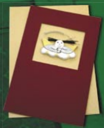
id1-30-001 Weihnachtskarte „Engel auf der Wolke“ Doppelkarte mit Holzfigur und Umschlag, 10 x 15 cm 4,50 €