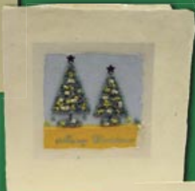
ph4-30-011 Weihnachtskarte „Tannen“ Doppelkarte mit Applikationen und Umschlag, 12 x 12,5 cm 2,70 €