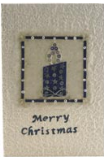
bd5-30-127 Weihnachtskarte „Stern“ Doppelkarte mit Umschlag, 12 x 18 cm 2,50 €