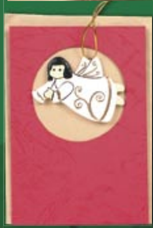
id1-30-005 Weihnachtskarte „Fliegender Engel“ Doppelkarte mit Holzfigur und Umschlag, 10 x 15 cm 5,50 €