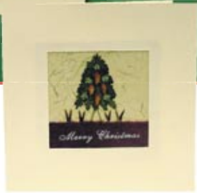
ph4-30-012 Weihnachtskarte „Baum“ Doppelkarte mit Applikationen und Umschlag, 12 x 12,5 cm 2,70 €