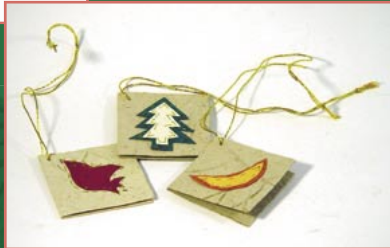
bd1-30-020 Geschenkanhänger mit Goldnaht handgeschöpftes Papier, 3er Set, 4 cm 1,79 €