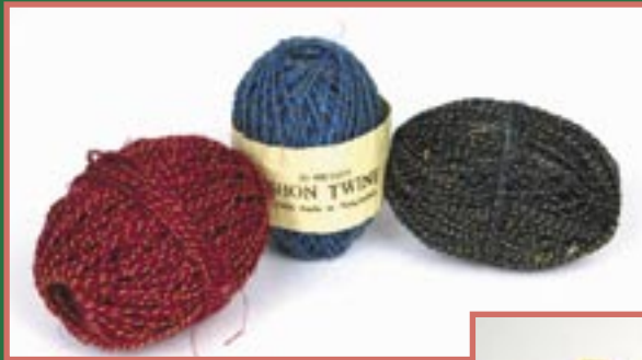
bd1-20-910 Macrameeschnur mit Goldfaden verschiedene Farben, 50 m 2,50 €