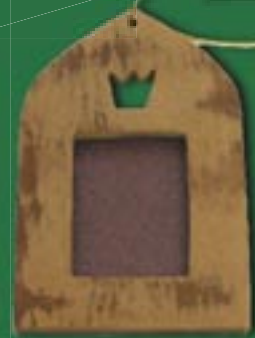
vi0-20-116 Mini-Bilderrahmen aus duftender Zimtrinde „Haus“ 8 x 10 cm 4,50 €