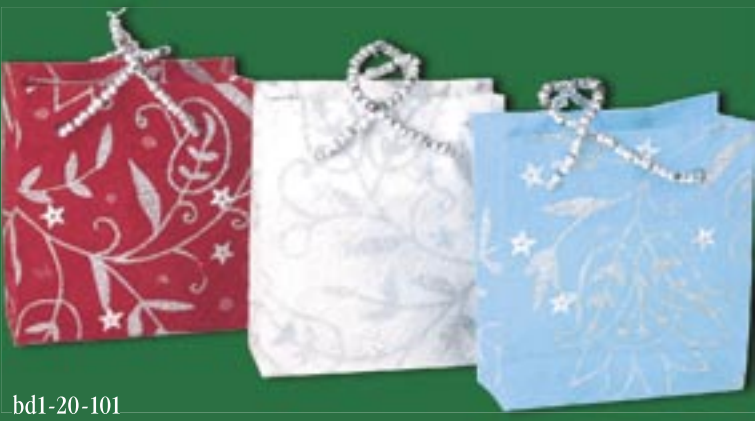
bd1-20-101 Geschenkbeutel handgeschöpftes Papier, rot/blau/grau, 3er Set, 6,5 x 2,5 x 7,5 cm 4,50 €