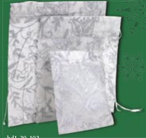
bd1-20-102 Geschenkbeutel handgeschöpftes Maulbeerpapier, grau/silber, 3er-Set, groß: 17 x 15 cm; mittel: 15 x 13 cm; klein: 11 x 9 cm 4,95 €