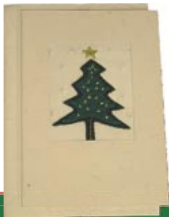
bd5-30-101 Weihnachtskarte „Dunkle Tanne“ Doppelkarte mit Stoffapplikation und Umschlag, 12 x 17 cm, 2,75 €