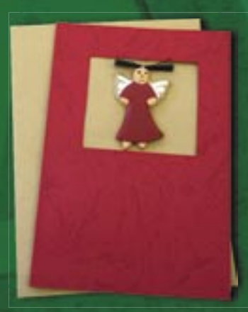
id1-30-002 Weihnachtskarte „Engel“ Doppelkarte mit Holzfigur und Umschlag, 10 x 15 cm 4,50 €