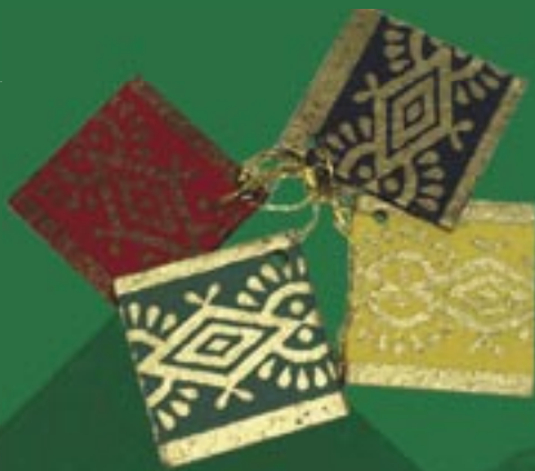
bd1-30-016 Geschenkanhänger 4er Set, 5,5 x 5,5 cm 1,99 €