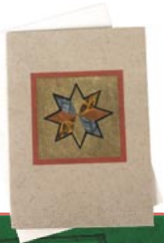
ph4-30-018 Weihnachtskarte „Stern“ Doppelkarte mit Applikationen und Umschlag, 12 x 17 cm 2,95 €