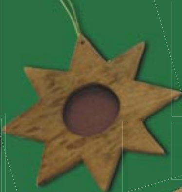
vi0-20-117 Mini-Bilderrahmen aus duftender Zimtrinde „Stern“ Ø 11 cm 4,50 €