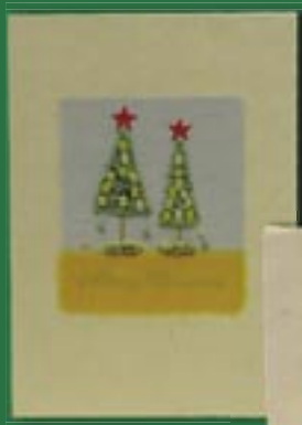
ph4-30-007 Weihnachtskarte „Sterne über Tannen“ Doppelkarte mit Applikationen und Umschlag, 10,5 x 15 cm 2,70 €