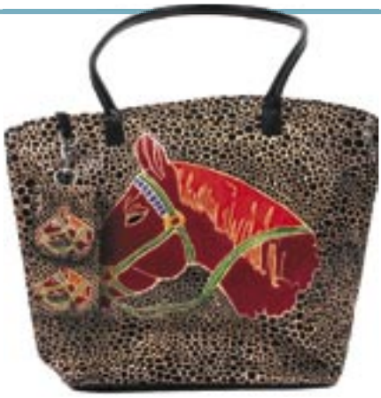
in5-20-116 Damentasche mit abnehmbarer Handytasche, Leder, schwarz, Pferdemotiv, 33 x 10 x 35 cm 34,90 €