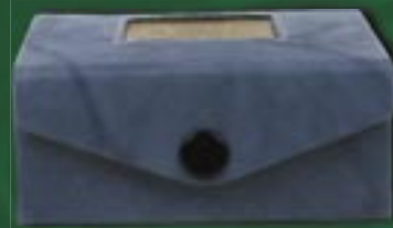
in0-20-843 Etui Rindsleder mit Messingapplikation, Antikoptik, grau, 9 x 8 x 4 cm 7,50 €