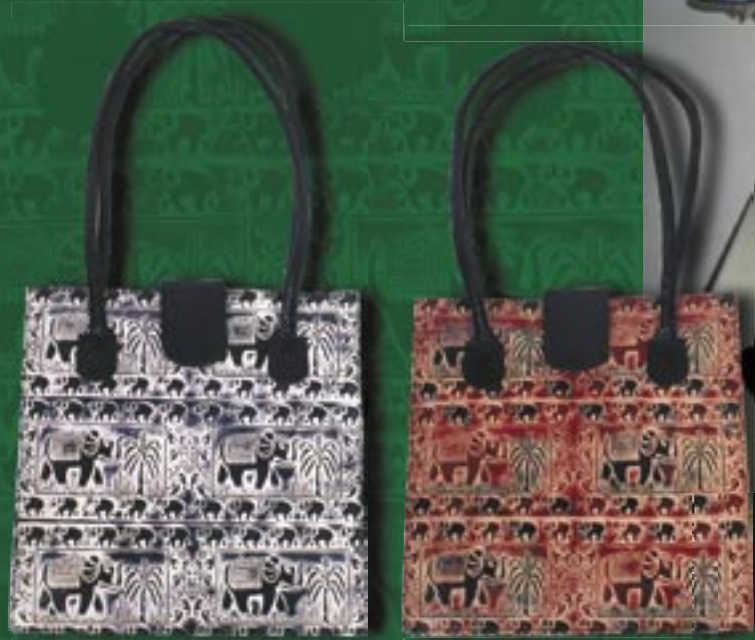
bd5-20-313 Damenhandtasche mit Reißverschluss und Innentaschen, Schafsheide, schwarz/natur, 29 x 10 x 30 cm, 49,90 €