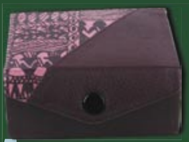
in0-20-823 Etui Rindsleder, Ethno-Design, rotbraun/pink, 9 x 8 x 4 cm 6,90 €