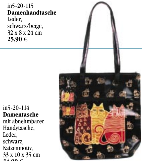
in5-20-114 Damentasche mit abnehmbarer Handytasche, Leder, schwarz, Katzenmotiv, 33 x 10 x 35 cm 34,90 €