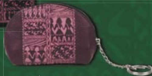
in0-20-824 Portemonnaie mit Schlüsselring Rindsleder, Ethno-Design, rotbraun/pink, 9 x 7 cm 5,90 €