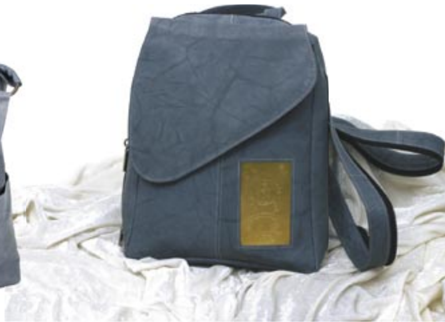
in0-20-841 Handtasche Rindsleder mit Messingapplikation, Antikoptik, grau, 35 x 7 x 32 cm 69,90 €