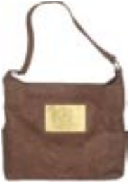
in0-20-831 Handtasche Rindsleder mit Messingapplikation, Antikoptik, braun, 35 x 7 x 32 cm 69,90 €