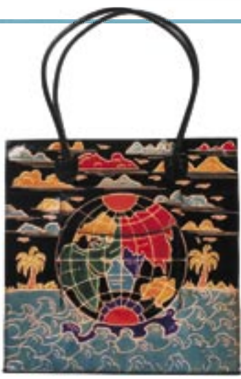
in5-20-118 Damentasche „Weltkugel“ Leder, 35 x 7 x 35 cm 32,90 €