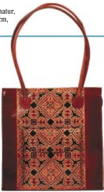
in5-20-119 Damentasche Leder, Brauntöne, 30 x 7 x 30 cm 26,90 €