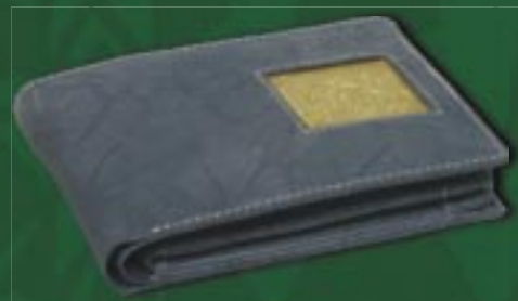
in0-20-842 Geldbörse Rindsleder mit Messingapplikation, Antikoptik, grau, 12 x 9 cm 22,50 €