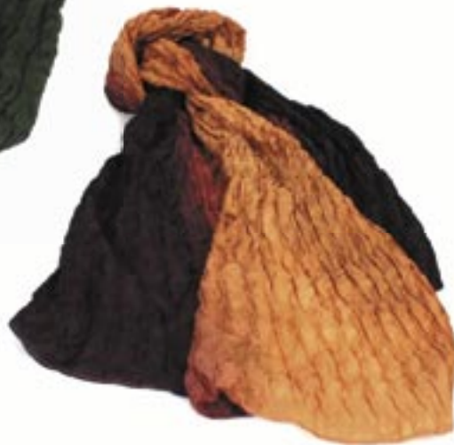
vi1-70-111 Seidenschal Crinkle-Optik, braun/orange, 80 x 180 cm 24,90 €