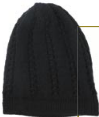
pe1-70-411 Mütze 50% Alpaka 50% Acryl, schwarz 19,90 €