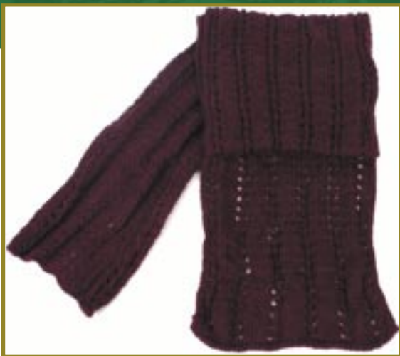
pe1-70-414 Schal 50% Alpaka 50% Acryl, bordeaux, 180 x 25 cm 34,90 €