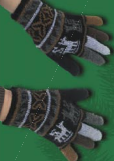
Handschuhe Alpaka, schwarz/blau/braun 19,90 €

pe8-70-001: Gr. M pe8-70-002: Gr. L pe8-70-003: Gr. XL