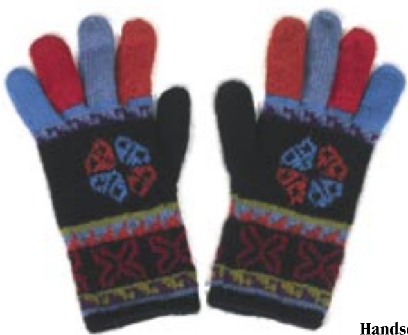
Handschuhe Alpaka, schwarz/bunt 19,90 €