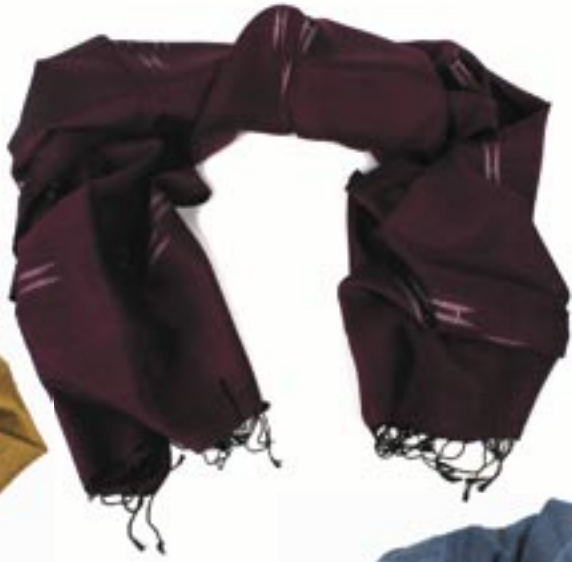
ne6-70-005 Dhaka Seidenschal handgewebt, weinrot, 35 x 180 cm 32,50 €