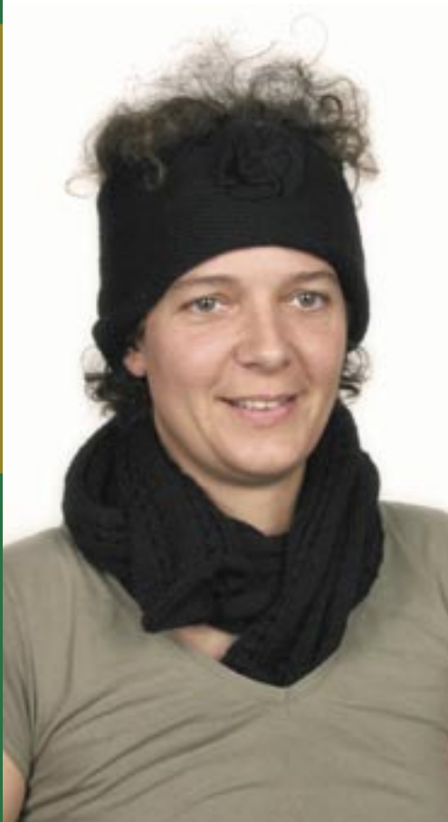
pe1-70-417 Stirnband 50% Alpaka 50% Acryl, schwarz 17,50 €