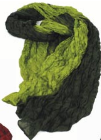
vi1-70-110 Seidenschal Crinkle-Optik, grün, 80 x 180 cm 24,90 €