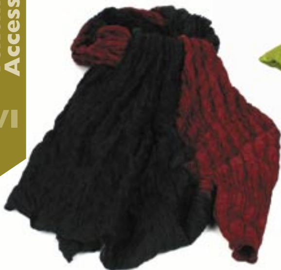
vi1-70-109 Seidenschal Crinkle-Optik, braun/schwarz, 80 x 180 cm 24,90 €