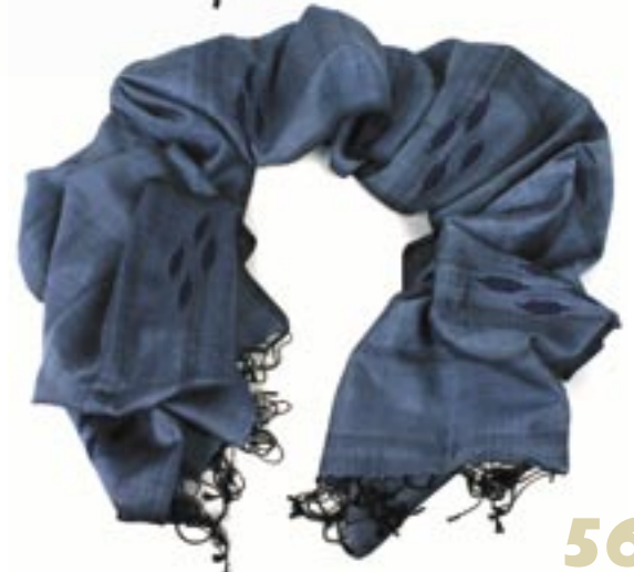
ne6-70-006 Dhaka Seidenschal handgewebt, taubenblau, 35 x 180 cm 32,50 €