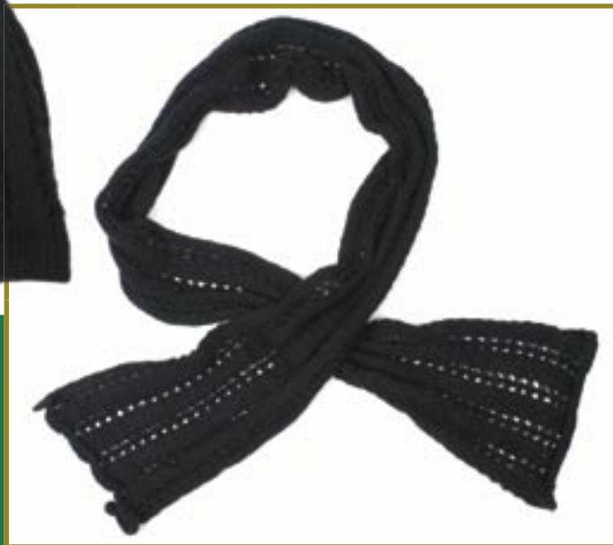
pe1-70-412 Schal 50% Alpaka 50% Acryl, schwarz, 180 x 25 cm 34,90 €