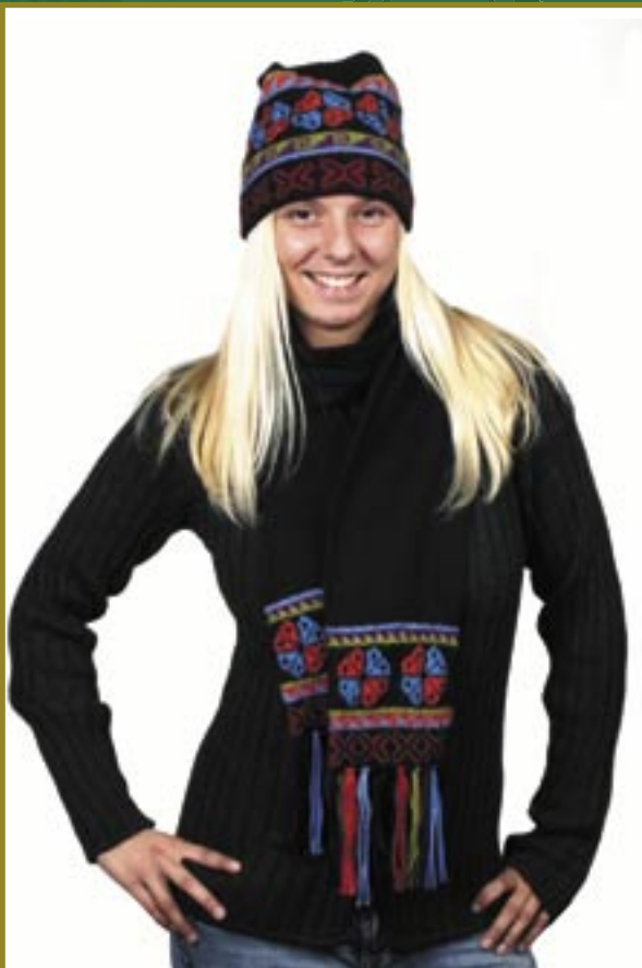
pe8-70-105 Mütze Alpaka, schwarz/bunt Gr. S 19,90 €