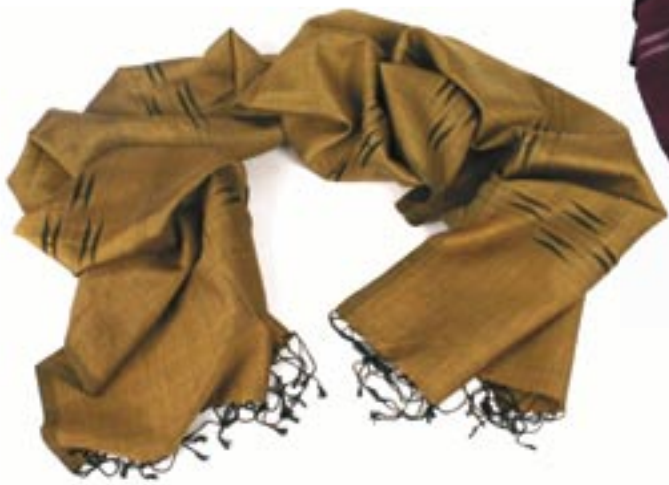
ne6-70-004 Dhaka Seidenschal handgewebt, ocker, 35 x 180 cm 32,50 €