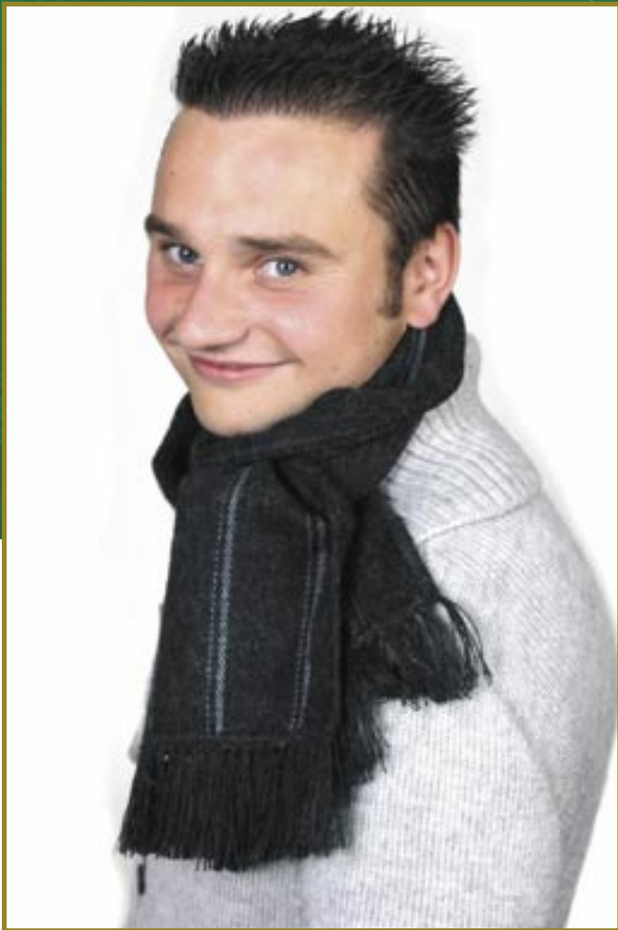
pe1-70-409 Herrenschal 50% Alpaka, 50% Acryl, anthrazit, 165 x 20 cm, 22,50 €