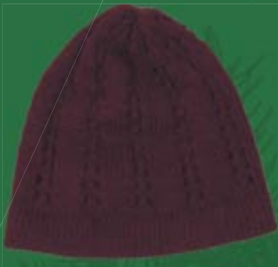
pe1-70-413 Mütze 50% Alpaka 50% Acryl, bordeaux 19,90 €