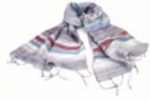
vi1-70-108 Seidenschal „Wintertraum“ handbemalt, 140 x 35 cm 19,95 €