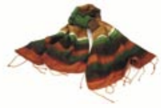
vi1-70-107 Seidenschal „Herbstlaub“ handbemalt, 140 x 35 cm 19,95 €