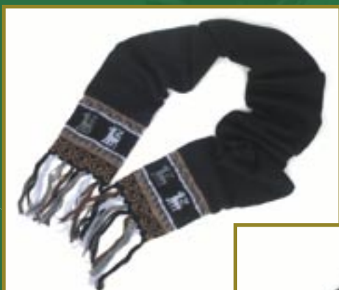
Mütze Alpaka schwarz/blau/braun 19,90 €