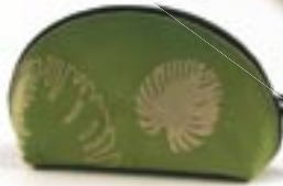
in0-20-789 Schlüsseltasche „Leaf“ Leder, Halbmond, mattgrün, 12 x 7 cm 6,90 €