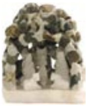
pe1-81-231 Krippe Stein und Alabaster 6,5 x 5,5 x 5 cm 12,50 €