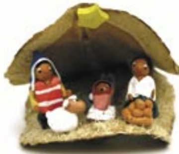
bo2-81-001 Krippe einteilig Keramik in Jacaranda-Schale 14,90 €