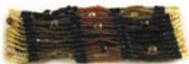
in0-40-054 Armband aus Glasperlen elastisch, braun, 3 cm breit 7,50 €