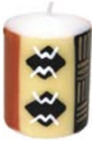
sa9-30-102 Stumpenkerze Vibrations 6,5 x 8 cm 7,90 €