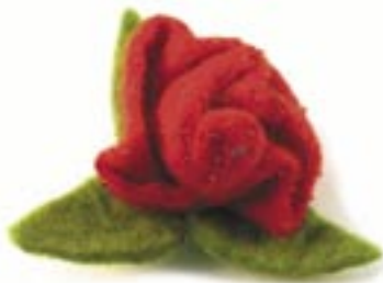
ne4-40-714 Filzbrosche „Rose“ 10 x 7 cm 5,50 €