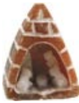
pe1-81-232 Krippe Stein und Alabaster 3 x 2,5 x 2,5 cm 6,90 €