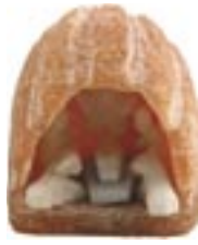
pe1-81-233 Krippe Stein und Alabaster 3,5 x 3 x 2 cm 6,90 €