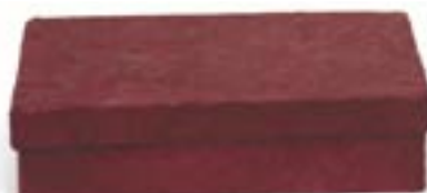
ne4-20-404 Geschenkbbox aus Pappmaschee rot, 21 x 15 x 5 cm 3,90 €