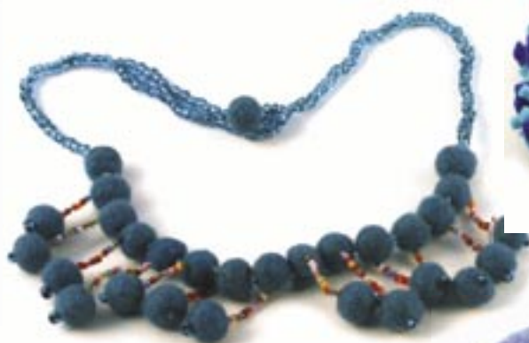
ne4-40-707 Halskette aus Filz und Glasperlen türkis L 50 cm 8,50 €