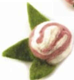
ne4-40-713 Filzbrosche „Blume“ 10 x 7 cm 4,50 €