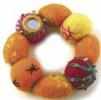
ne4-40-705 Armband aus bunt dekorierten Filzkugeln dehnbar 4,90 €