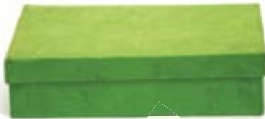
ne4-20-401 Geschenkbbox aus Pappmaschee grün, 21 x 15 x 5 cm 3,90 €