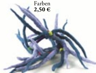
ne4-40-701 Haarband aus Filz blau/türkis 3,90 €