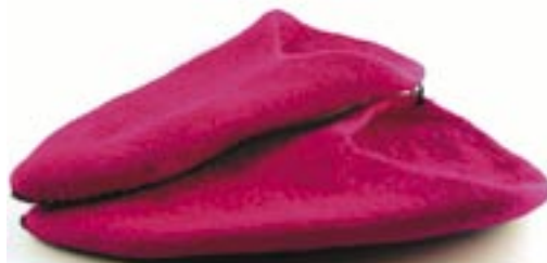
ne4-70-611 Kuschelige Slipper aus Filz pink Größe 36/37 17,50 €