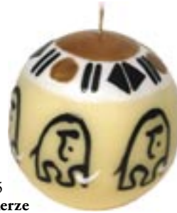
sa9-30-305 Kugelkerze „Afrikanischer Elefant“ Ø 8 cm 8,90 €