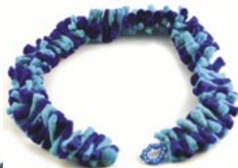
ne4-40-709 Halskette aus Filz und Glasperlen türkis/blau, L 50 cm 8,90 €