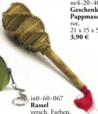
in0-60-067 Rassel versch. Farben, L 30 cm 1,95 €