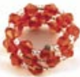
ne4-40-201 Ring aus Glasperlen silber/rot 2,50 €