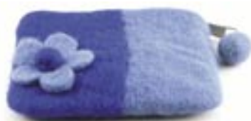
ne4-26-307 Kleines Filztäschchen hellblau/dunkelblau, gefüttert, 14 x 11 cm 4,90 €