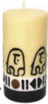
sa9-30-105 Stumpenkerze Afrikanischer Elefant 6,5 x 12 cm 11,90 €