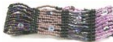
in0-40-055 Armband aus Glasperlen elastisch, lila, 3 cm breit 7,50 €