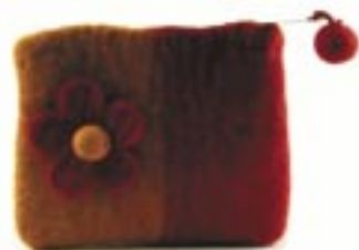
ne4-26-309 Kleines Filztäschchen rot/orange, gefüttert, 14 x 11 cm 4,90 €

Die kuschligen Slipper aus Filz sind außerdem in den Farben Orange, Grün und Dunkelblau sowie auch in den Größen 38/39 und 42/43 erhältlich.