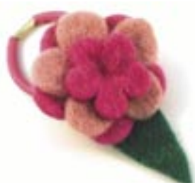
ne4-40-704 Haarband aus Filz „Blume“ 6 x 9 cm 3,90 €