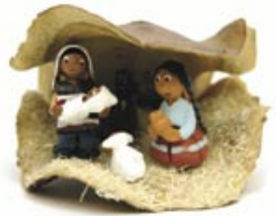
bo2-81-002 Krippe einteilig Keramik in Jacaranda-Schale 14,90 €