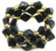
ne4-40-203 Ring aus Glasperlen schwarz/gold 2,50 €