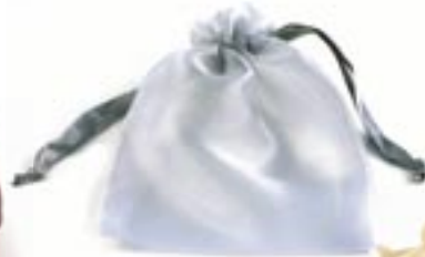
vi0-20-222 Transparenter Geschenbeutel aus Organza silber, 18 x 12 cm 1,60 €