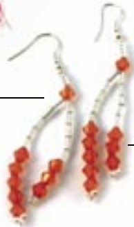
ne4-40-211 Ohrhinge aus Glasperlen rot/silber L 6 cm 2,90 €