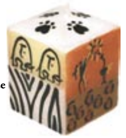
sa9-30-201 Stumpenkerze Afrika quadratisch 7 x 7 x 8 cm 8,90 €