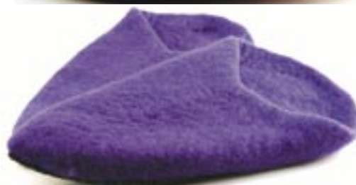
ne4-70-613 Kuschelige Slipper aus Filz fuchsia Größe 40/41 17,50 €

Die kuschligen Slipper aus Filz sind außerdem in den Farben Orange, Grün und Dunkelblau sowie auch in den Größen 38/39 und 42/43 erhältlich.