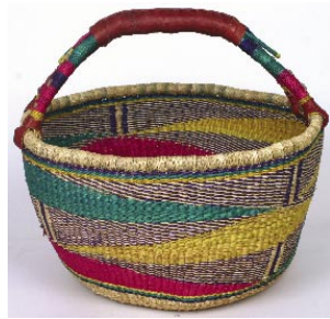
gh2-22-727 Bolga-Tanga-Korb aus feinem Gras Design „Summertime“, Ø 40 cm 22,90 €