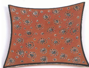
ke7-80-898 Zierteller aus Kisii Speckstein bemalt, terra, ca. 15 x 15 cm 12,90 €