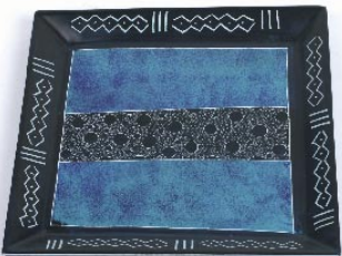
ke7-80-879 Zierteller aus Kisii Speckstein bemalt, blau, ca. 20 x 20 cm 18,90 €