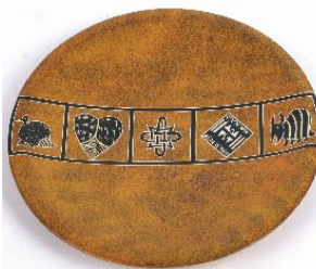
ke7-80-894 Zierteller aus Kisii Speckstein bemalt, orange, ca. Ø 20 cm 12,90 €