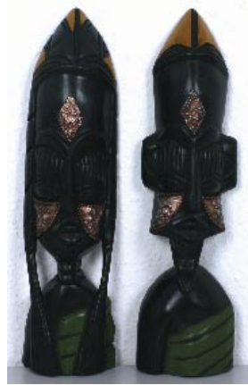
gh2-80-976 Trad. Wandmaske aus Holz „Paar“ 43 cm 69,90 €