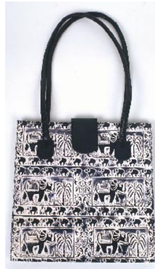
bd5-20-313 Damenhandtasche aus Schafsfleder schwarz/natur, 29 x 10 x 30 cm mit Reißverschluss und Innentaschen 49,90 €