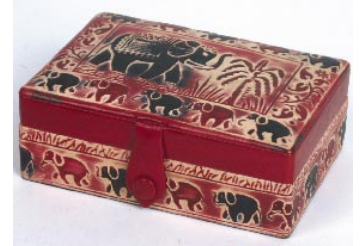
bd5-20-362 Schmuckschatulle aus Schafsfleder rot/schwarz/natur, 15 x 10,5 x 6 cm mit Innenspiegel und Ringfach 24,90 €