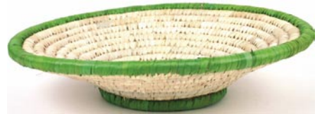
Obstschale aus Palmbblatt Ø 30 cm, H 8 cm 5,90 € bd5-20-259 brauner Rand bd5-20-260 grüner Rand