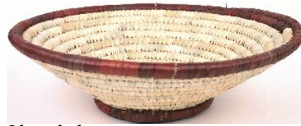
Obstschale aus Palmbblatt Ø 35 cm, H 9 cm 6,90 € bd5-20-261 brauner Rand bd5-20-262 grüner Rand