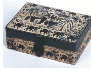
bd5-20-361 Schmuckschatulle aus Schafsfleder schwarz/natur, 15 x 10,5 x 6 cm mit Innenspiegel und Ringfach 24,90 €