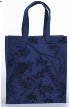
bd0-26-510 Jutetasche „Pfau“ mit Innenversiegelung hellblau, Henkel ca. 50 cm, ca. 36 x 12 x 40 cm 6,90 €