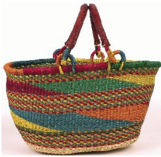
gh2-22-732 Bolgakorb für Auto und Picknick Design „Beach“, oval, 43 x 31 cm, H 27 cm 24,90 €