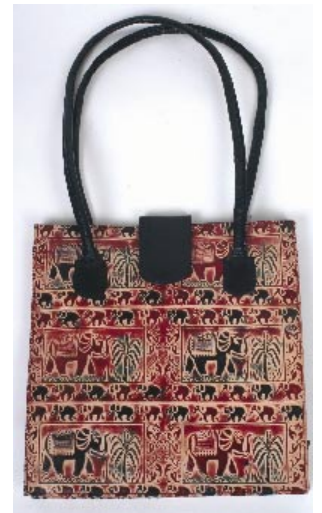
bd5-20-314 Damenhandtasche aus Schafsfleder rot/schwarz/natur, 29 x 10 x 30 cm mit Reißverschluss und Innentaschen 49,90 €