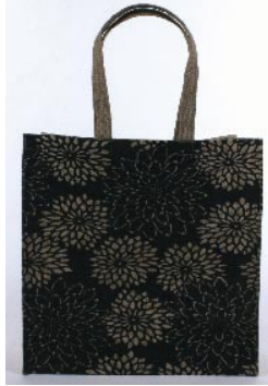
bd0-26-511 Jutetasche „Blume“ mit Innenversiegelung natur/schwarz, Henkel ca. 50cm, ca. 36 x 12 x 40cm 6,90 €