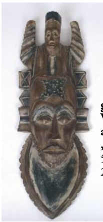
gh2-80-975 Wandmaske aus Holz „Zwei Köpfe“ 50 x 17 cm 29,90 €