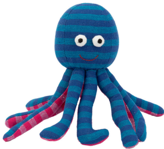
SL9-90-134 Softtoy "Krake" Obermaterial: 100% handgewebte Baumwolle, Füllung: Polyester, blau/pink, 14 x 6 cm empf. VK: 14,90 € - 18,90 €