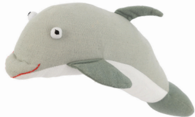
SL9-90-133 Softtoy "Delfin" Obermaterial: 100% handgewebte Baumwolle, Füllung: Polyester, grau, 12 x 23 cm empf. VK: 14,90 € - 18,90 €