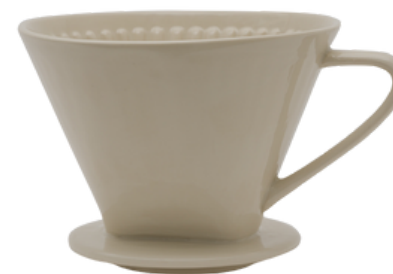
TL5-20-402 Kaffeefilter, Passform: Kaffeefiltergröße 101 Keramik, geeignet für die Spülmaschine, creme, H 6,5 cm, Ø 10 cm empf. VK: 14,90 € - 18,90 €