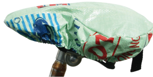
V10-22-034 Fahrradsattelüberzug aus recycelten Reissäcken Obermaterial: 100% Polypropylen, Innenfutter: 100% Polyester, 29 x 26 cm empf. VK: 6,90 € - 8,90 €