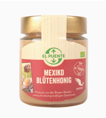
ME0-16-301 Bio-Blütenhonig aus Mexiko cremig, kbA, 500 g empf. VK: 8,50 €