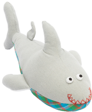
SL9-90-132 Softtoy "Hai" Obermaterial: 100% handgewebte Baumwolle, Füllung: Polyester, grau, 11 x 29 cm empf. VK: 14,90 € - 18,90 €