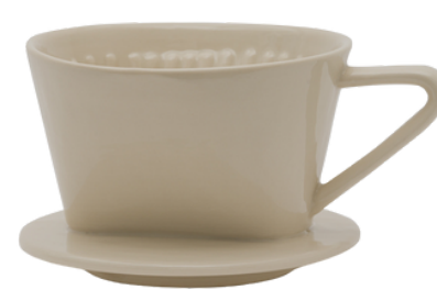
TL5-20-403 Kaffeefilter, Passform: Kaffeefiltergröße 4 Keramik, geeignet für die Spülmaschine, creme, H 10 cm, Ø 13,5 cm empf. VK: 19,90 € - 24,90 €