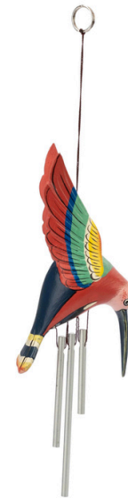
ID7-80-141 Windspiel "Kolibri" Regenbaumholz, Aluminium, pink/bunt, L 20 cm empf. VK: 9,90 € - 12,90 €