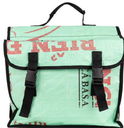
V10-22-045 Fahrradsatteltasche aus recycelten Reissäcken 100% Polypropylen, verschiedene Farben, je Seite 36 x 12 x 30 cm empf. VK: 34,90 € - 41,90 €