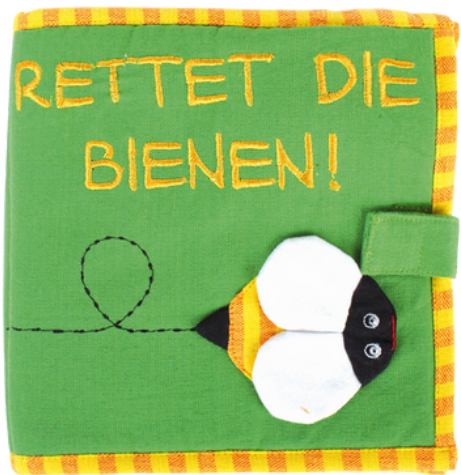
SL9-90-092 Entdeckungsbuch "Rettet die Bienen" 100% handgewebte Baumwolle, Füllung: Polyester, 4-seitig, zum spielerischen Lernen und Entdecken, gelb/bunt, 18 x 18 cm empf. VK: 29,90 € - 35,90 €