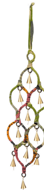
IN4-81-347 Windspiel Eisen, recycelter Sari-Stoff, bunt, 33 x 13 cm empf. VK: 12,90 € - 15,90 €