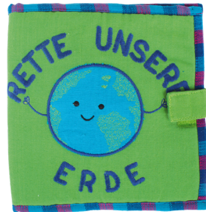
SL9-90-096 Entdeckungsbuch "Rette unsere Erde" 100% handgewebte Baumwolle, Füllung: Polyester, 4-seitig, zum spielerischen Lernen und Entdecken, grün/bunt, 18 x 18 cm empf. VK: 29,90 € - 35,90 €