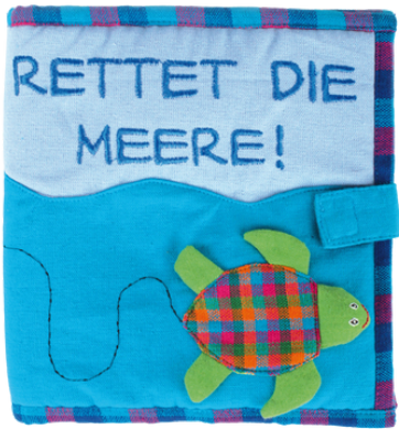
SL9-90-095 Entdeckungsbuch "Rettet die Meere" 100% handgewebte Baumwolle, Füllung: Polyester, 4-seitig, zum spielerischen Lernen und Entdecken, türkis/bunt, 18 x 18 cm empf. VK: 29,90 € - 35,90 €