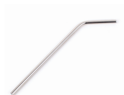
IN4-24-032 Strohalm Edelstahl, geeignet für die Spülmaschine, L 20 cm empf. VK: 4,90 € - 6,90 €