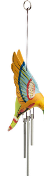
ID7-80-142 Windspiel "Kolibri" Regenbaumholz, Aluminium, gelb/bunt, L 20 cm empf. VK: 9,90 € - 12,90 €