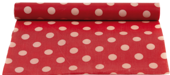
IN2-20-354 Bienenwachstuch-Rolle "Dots" 100% Baumwolle aus kbA, mit Bienenwachs behandelt, individuell zuschneidbar, beige/rot, 30 x 150 cm empf. VK: 29,90 € - 35,90 €