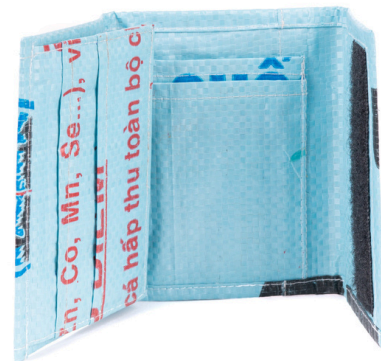
V10-22-041 Geldbörse recycelte Reissäcke, 100% Polypropylen, verschiedene Farben, 12 x 9 cm empf. VK: 8,90 € - 10,90 €