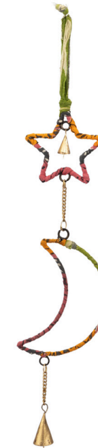
IN4-81-345 Windspiel "Mond und Stern" Eisen, recycelter Sari-Stoff, bunt, 38 x 12 cm empf. VK: 9,90 € - 12,90 €