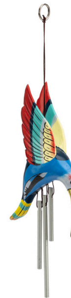
ID7-80-143 Windspiel "Kolibri" Regenbaumholz, Aluminium, blau/bunt, L 20 cm empf. VK: 9,90 € - 12,90 €