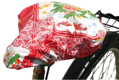
V10-22-035 Fahrradsattelüberzug Obermaterial: 100% Polypropylen, Innenfutter: 100% Polyester, rot mit Blumenmuster, 28 x 26 cm empf. VK: 6,90 € - 8,90 €