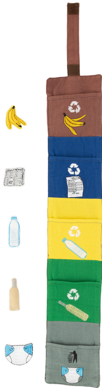
SL9-90-097 Spielset "Mein erster Müll" 100% handgewebte Baumwolle, Füllung: Polyester, 6-teilig, zum spielerischen Lernen, bunt, L ca. 59 cm empf. VK: 14,90 € - 18,90 €