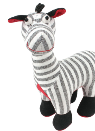
SL9-90-003 Softtoy "Zebra" Obermaterial: 100% handgewebte Baumwolle, Füllung: Polyester, H 19 cm empf. VK: 19,90 € - 24,90 €