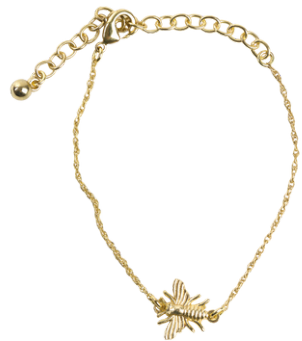
IN1-40-905 Armband "Biene" Messing, gold, ca. L 16 cm + Verlängerung, Anhänger 1,5 x 1,3 cm empf. VK: 9,90 € - 12,90 €