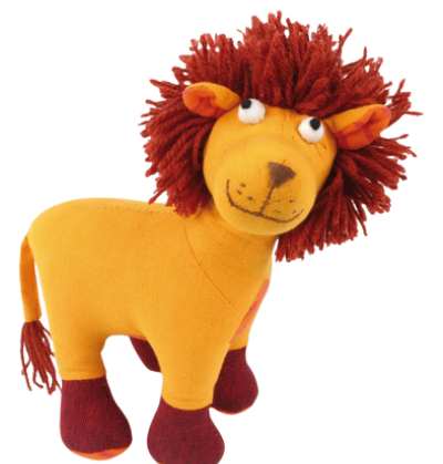
SL9-90-004 Softtoy "Löwe" Obermaterial: 100% handgewebte Baumwolle, Füllung: Polyester, H 18 cm empf. VK: 19,90 € - 24,90 €