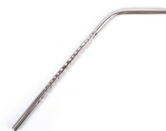
IN4-24-034 Strohalm Edelstahl, gewellt, geeignet für die Spülmaschine, L 21 cm empf. VK: 4,90 € - 6,90 €