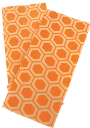
IN2-20-350 Bienenwachstücher "Wabe", 2er-Set 100% Baumwolle aus kbA, mit Bienenwachs behandelt, beige/gelb, 30 x 30 und 20 x 20 cm empf. VK: 14,90 € - 18,90 €