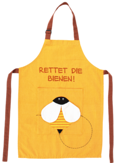
SL9-20-109 Kinderschürze "Rettet die Bienen" 100% handgewebte Baumwolle, gelb/orange/schwarz/weiß, L 77 cm empf. VK: 28,90 € - 34,90 €