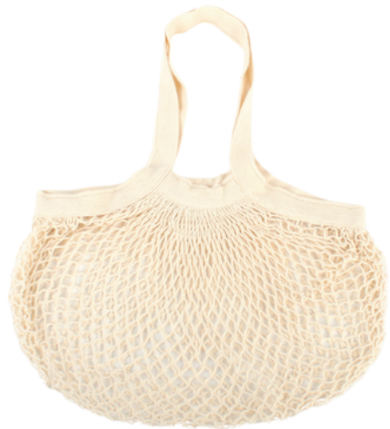
IN2-22-769 Einkaufsnetz 100% Baumwolle aus kbA, natur, ca. 35 x 35 cm, Griff 20 cm empf. VK: 9,90 € - 12,90 €