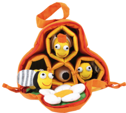
SL9-90-091 Spielset "Bienenstock" 100% handgewebte Baumwolle, Füllung: Polyester, 5-teilig mit Waben, Bienenkönigin, Arbeiterin, Drohne, Eiern und Blumenwiese, ca. 19 x 8 x 15 cm empf. VK: 39,90 € - 49,70 €