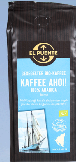
NI2-13-163 Kaffee Ahoi! Bio-Kaffeebohnen 250 g gesegelt empf. VK: 9,90 €