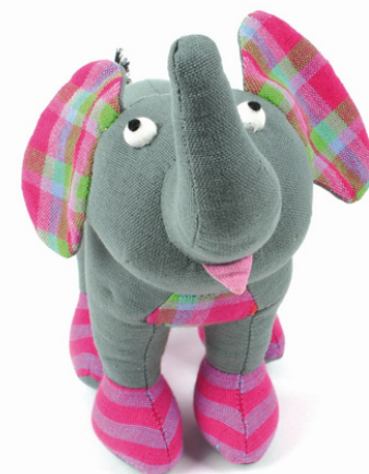
SL9-90-001 Softtoy "Elefant" Obermaterial: 100% handgewebte Baumwolle, Füllung: Polyester, H 20 cm empf. VK: 19,90 € - 24,90 €