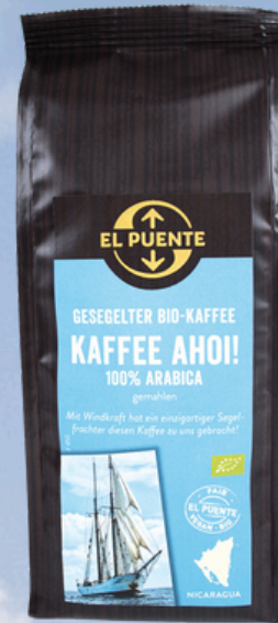
NI2-13-160 Kaffee Ahoi! Bio-Kaffee gemahlen 250 g gesegelt empf. VK: 9,90 €

Das Segelfrachtschiff verbindet das nachhaltige Engagement der Produzent*innen in Nicaragua mit dem der europäischen Kund*innen.