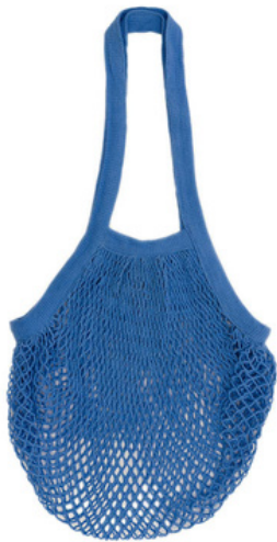
IN2-22-770 Einkaufsnetz 100% Baumwolle aus kbA, verschiedene Farben, ca. 35 x 35 cm, Griff 20 cm empf. VK: 9,90 € - 12,90 €