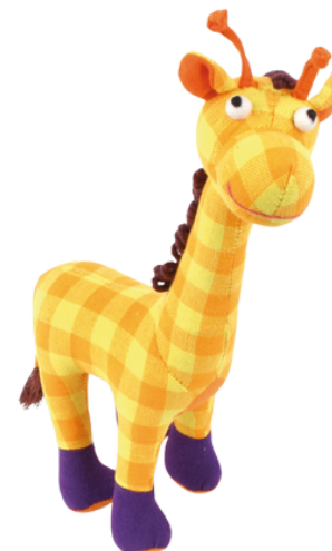
SL9-90-002 Softtoy "Giraffe" Obermaterial: 100% handgewebte Baumwolle, Füllung: Polyester, H 28 cm empf. VK: 19,90 € - 24,90 €