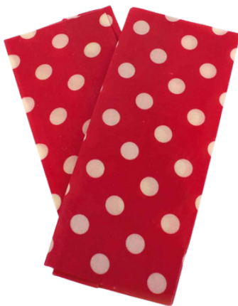
IN2-20-352 Bienenwachstücher "Dots", 2er-Set 100% Baumwolle aus kbA, mit Bienenwachs behandelt, beige/rot, 30 x 30 und 20 x 20 cm empf. VK: 14,90 € - 18,90 €