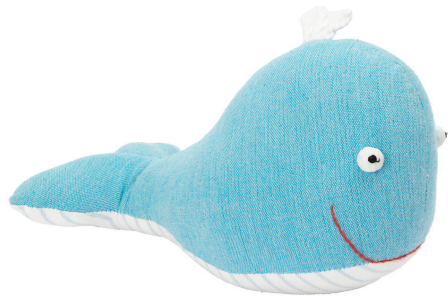
SL9-90-131 Softtoy "Wal" Obermaterial: 100% handgewebte Baumwolle, Füllung: Polyester, blau, 15 x 24 cm empf. VK: 14,90 € - 18,90 €