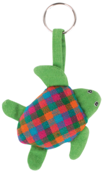
SL9-20-110 Schlüsselhänger "Rettet die Meere" Obermaterial: 100% handgewebte Baumwolle, Füllung: Polyester, grün/bunt, L 12 cm empf. VK: 4,90 € - 6,90 €