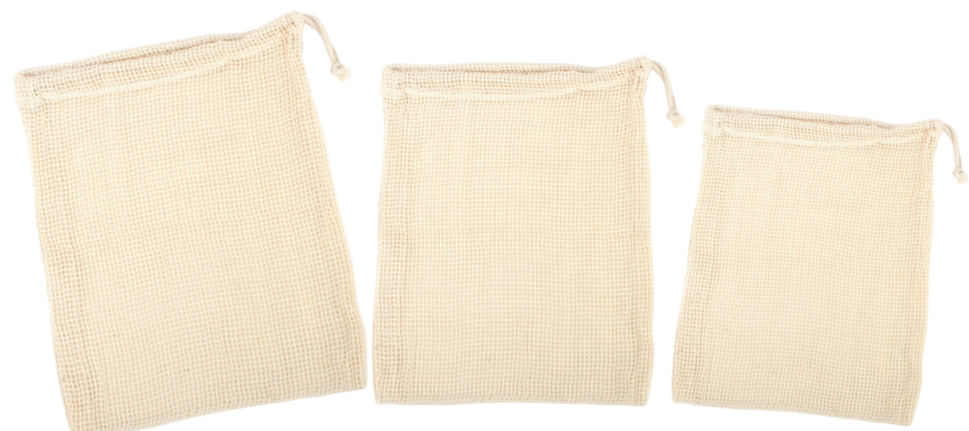
IN2-22-771 Gemüsebeutel, Größe L 100% Baumwolle aus kbA, natur, 30 x 35 cm empf. VK: 5,90 € - 7,90 €