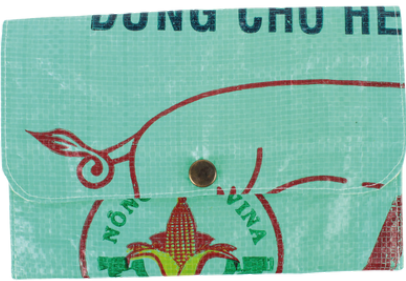
VIO-22-042 Multifunktionsstäschchen aus recycelten Reissäcken Obermaterial: 100% Polypropylen, Innenfutter: 100% Baumwolle, verschiedene Farben, 18 x 12 cm empf. VK: 5,90 € - 7,90 €