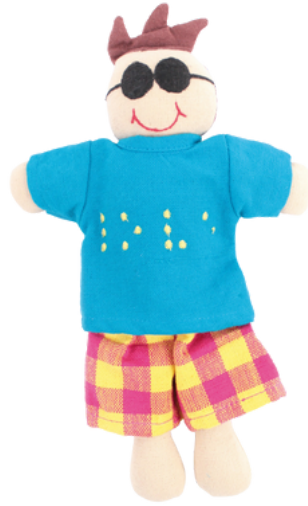
SL9-90-078 Vielfaltspuppe "Chino" 100% handgewebte Baumwolle, Füllung: 100% Polyester, 3- teilig, Anziehpuppe blind, L 23 cm empf. VK: 13,90 € - 17,90 €