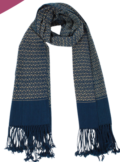
TL6-70-006 Schal aus Flüchtlingsprojekt mit Pflanzenfarben 100% Baumwolle, gefärbt, handgewebt, blau/gelb, 40 x 180 cm empf. VK: 79,00 € - 95,00 €

Diese kunstvoll gewebten Schals sind mehr als nur stilvolle Accessoires – sie sind Ausdruck von Hoffnung und Selbstbestimmung . In Camps für Geflüchtete an der Grenze zu Myanmar ermöglicht die Organisation WEAVE Frauen, durch das Weben und Färben mit natürlichen Pflanzenfarben ein eigenes Einkommen zu erzielen. Die filigranen Muster und die sanften Farbtöne machen jeden Schal zu einem Unikat – fair produziert, mit großer Sorgfalt und viel Herzblut gefertigt. Mit dem Kauf dieser Schals unterstützt Ihr nicht nur traditionelles Handwerk, sondern auch ein Projekt, das Perspektiven schafft .