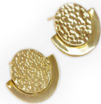
KE6-40-006 Ohrstecker "Hope" recyceltes Messing, teils gehämmert, goldfarben, ca. 2,3 x 2 cm empf. VK: 27,90 € - 33,90 €