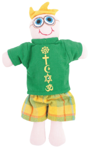
SL9-90-072 Vielfaltspuppe "Hawi" 100% handgewebte Baumwolle, Füllung: 100% Polyester, 3-teilig, Anziehpuppe mit religiösen Symbolen, L 23 cm empf. VK: 13,90 € - 17,90 €