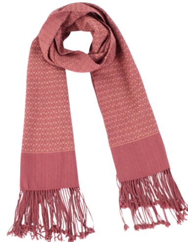
TL6-70-007 Schal aus Flüchtlingsprojekt mit Pflanzenfarben 100% Baumwolle, gefärbt, handgewebt, rosé/beige, 40 x 180 cm empf. VK: 79,00 € - 95,00 €