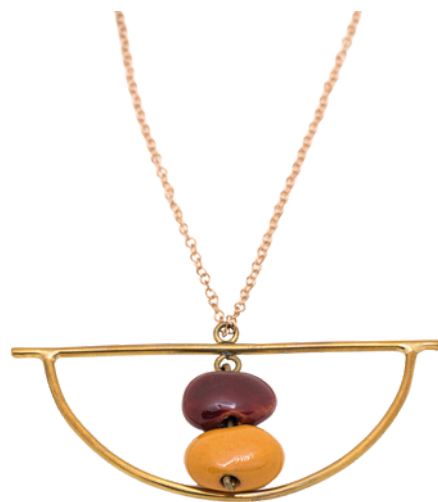
KE6-40-045 Halskette aus Projekt für Geflüchtete Keramik, recyceltes Messing, gold/rot/gelb, ca. L 50 cm + Verlängerung, Anhänger L 2,5 cm empf. VK: 39,90 € - 47,90 €