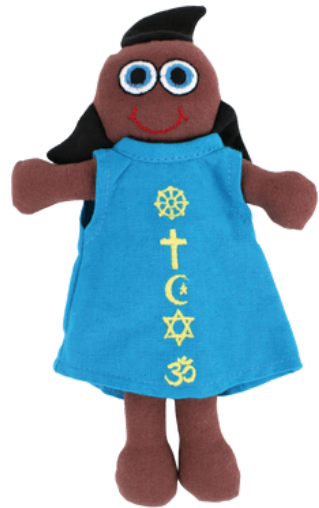
SL9-90-071 Vielfaltspuppe "Momo" 100% handgewebte Baumwolle, Füllung: 100% Polyester, 2-teilig, Anziehpuppe mit religiösen Symbolen, L 23 cm empf. VK: 13,90 € - 17,90 €