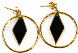
KE6-40-034 Ohrringe recyceltes Kuhhorn, recyceltes Messing, goldfarben, schwarz, ca. L 4 cm, Ø 3 cm empf. VK: 29,90 € - 35,90 €