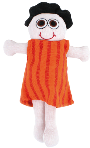
SL9-90-077 Vielfaltspuppe "Julia" 100% handgewebte Baumwolle, Füllung: 100% Polyester, 2- teilig, Anziehpuppe, schwanger, L 22 cm empf. VK: 13,90 € - 17,90 €