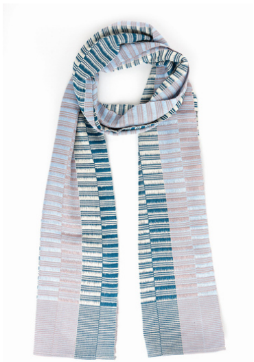
TL6-70-013 Schal aus Flüchtlingsprojekt 100% Viskose, blau/creme, 27 x 170 cm empf. VK: 59,00 € - 69,00 €