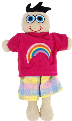
SL9-90-075 Vielfaltspuppe "Hedda" 100% handgewebte Baumwolle, Füllung: 100% Polyester, 3-teilig, Anziehpuppe mit bunter Kleidung und Regenbogen, L 23 cm empf. VK: 13,90 € - 17,90 €