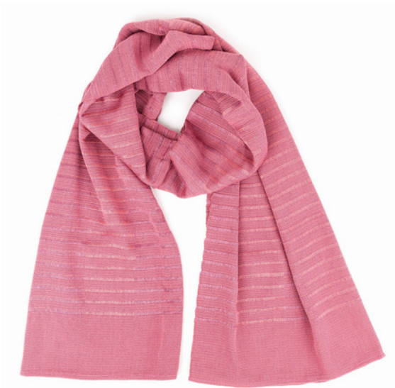
TL6-70-018 Umschlagtuch aus Flüchtlingsprojekt 100% Viskose, rosé, 60 x 170 cm empf. VK: 89,00 € - 109,00 €