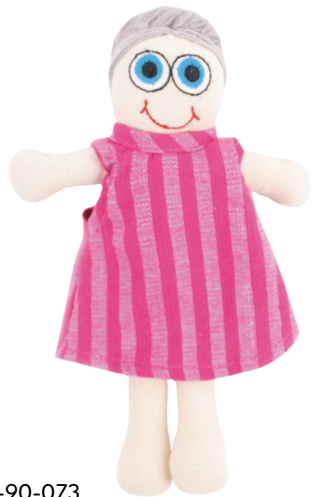
SL9-90-073 Vielfaltspuppe "Selma" 100% handgewebte Baumwolle, Füllung: 100% Polyester, 2-teilig, Anziehpuppe mit grauen Haaren, L 22 cm empf. VK: 13,90 € - 17,90 €