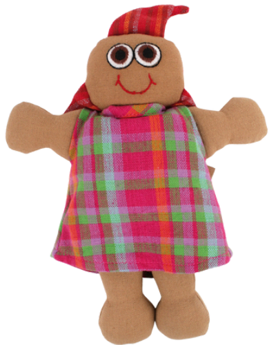
SL9-90-079 Vielfaltspuppe "Malsha" 100% handgewebte Baumwolle, Füllung: 100% Polyester, 2- teilig, Anziehpuppe groß, L 23 cm empf. VK: 13,90 € - 17,90 €