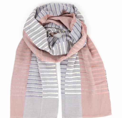
TL6-70-020 Umschlagtuch aus Flüchtlingsprojekt 100% Viskose, rosé/creme/blau, 60 x 170 cm empf. VK: 89,00 € - 109,00 €