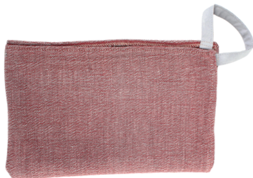
AE2-70-201 Geschirrtuch aus Projekt für Geflüchtete 70% handgewebte Baumwolle aus kbA, 30% Viskose, rot/grau meliert, 45 x 60 cm empf. VK: 9,90 € - 12,90 €