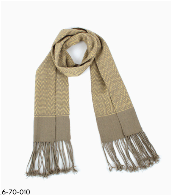
TL6-70-010 Schal aus Flüchtlingsprojekt mit Pflanzenfarben 100% Baumwolle, gefärbt, handgewebt, grau/gelb, 20 x 160 cm empf. VK: 59,00 € - 69,00 €