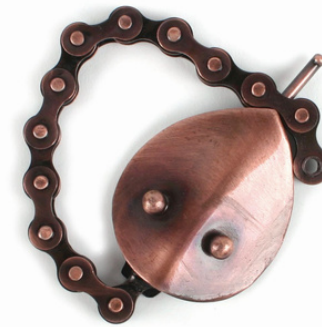
IN4-20-722 Flaschenöffner "Schlange" recycelte Fahrradkette, Eisen, Kupferbeschichtung, 24 cm empf. VK: 5,90 € - 7,90 €