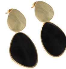
KE6-40-024 Ohrringe recyceltes Kuhhorn, recyceltes Messing, goldfarben, schwarz, ca. L 4 cm empf. VK: 27,90 € - 33,90 €