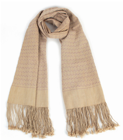
TL6-70-011 Schal aus Flüchtlingsprojekt mit Pflanzenfarben 100% Baumwolle, gefärbt, handgewebt, beige/lila, 40 x 180 cm empf. VK: 59,00 € - 69,00 €