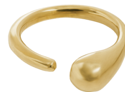
KE6-40-037 Ring recyceltes Messing, goldfarben, offen empf. VK: 27,90 € - 33,90 €