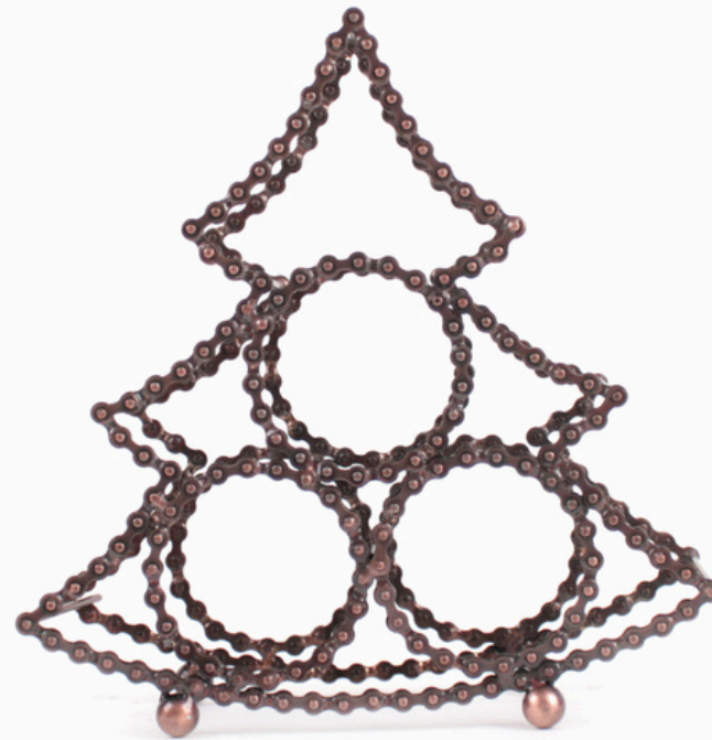
IN4-21-001 Flaschenhalter "Tanne" für 3 Flaschen, recycelte Fahrradkette, kupferfarben, 30 x 10,5 x 30 cm empf. VK: 34,90 € - 41,90 €