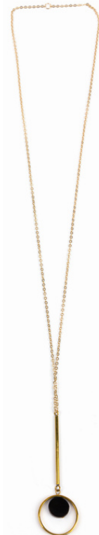
KE6-40-035 Halskette "Bawa" recyceltes Kuhhorn, recyceltes Messing, gold/schwarz, ca. L 46 cm + Verlängerung, Anhänger L 8 cm empf. VK: 39,90 € - 47,90 €