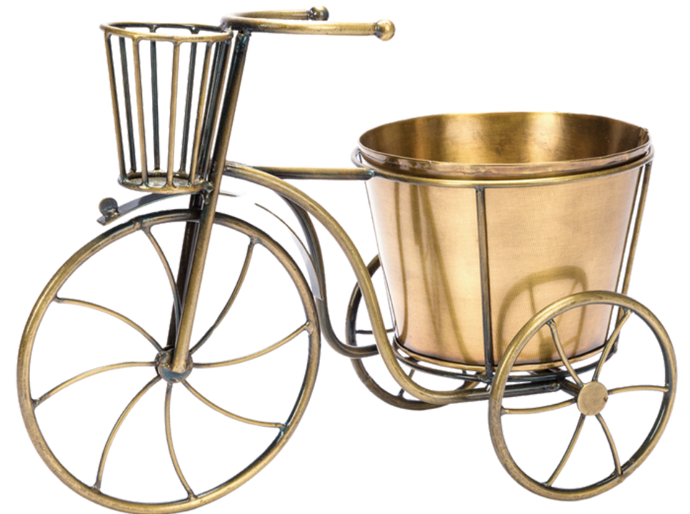
IN4-81-313 Blumentopfhalter "Fahrrad" recyceltes Eisen, ein Blumentopf zum Herausnehmen, kupferfarben, 30 x 15 x 22 cm empf. VK: 29,90 € - 35,90 €