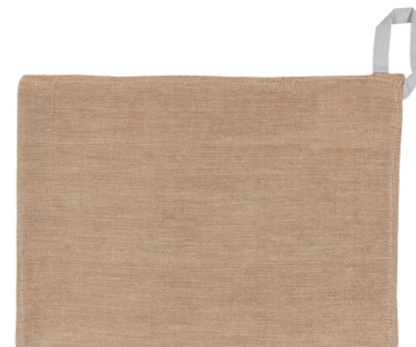
AE2-70-203 Geschirrtuch aus Projekt für Geflüchtete 70% handgewebte Baumwolle aus kbA, 30% Viskose, orange/grau meliert, 45 x 60 cm empf. VK: 9,90 € - 12,90 €