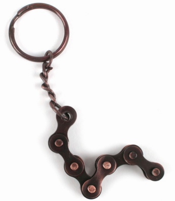
IN4-20-724 Schlüsselanhängers recycelte Fahrradkette, Eisen, Kupferbeschichtung, 6 cm empf. VK: 3,90 € - 4,90 €