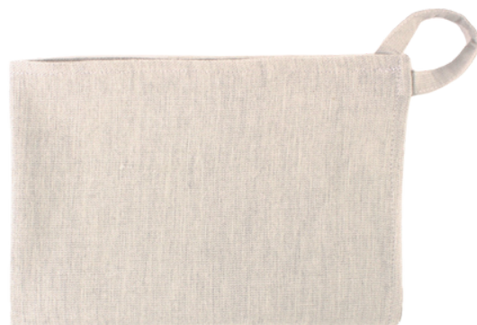
AE2-70-202 Geschirrtuch aus Projekt für Geflüchtete 70% handgewebte Baumwolle aus kbA, 30% Viskose, grau/hellgrau meliert, 45 x 60 cm empf. VK: 9,90 € - 12,90 €