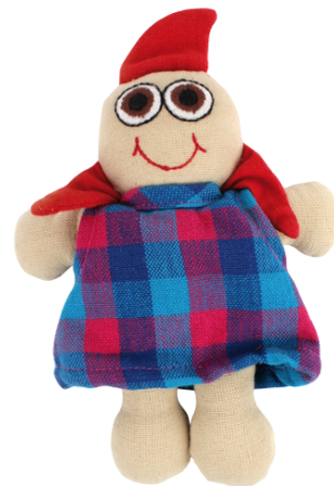
SL9-90-080 Vielfaltspuppe "Sara" 100% handgewebte Baumwolle, Füllung: 100% Polyester, 2- teilig, Anziehpuppe klein, L 18 cm empf. VK: 13,90 € - 17,90 €