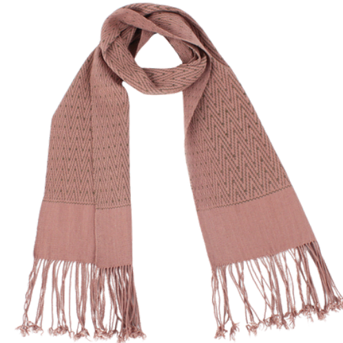
TL6-70-008 Schal aus Flüchtlingsprojekt mit Pflanzenfarben 100% Baumwolle, gefärbt, handgewebt, rosé/khaki, 20 x 160 cm empf. VK: 59,00 € - 69,00 €