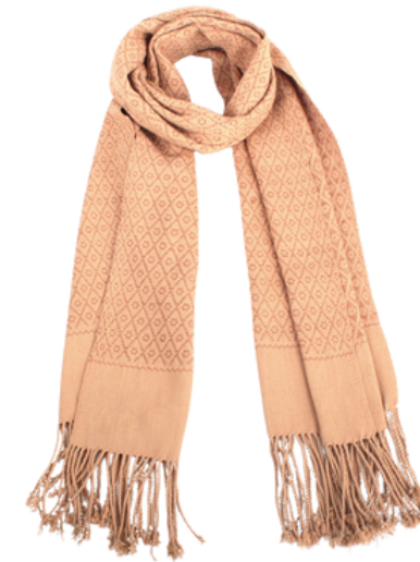
TL6-70-004 Schal aus Flüchtlingsprojekt mit Pflanzenfarben 100% Baumwolle, gefärbt, handgewebt, beige/khaki, 40 x 180 cm empf. VK: 79,00 € - 95,00 €