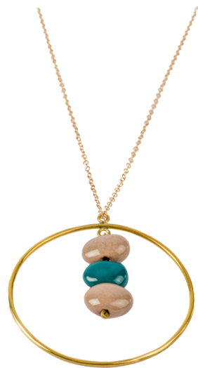
KE6-40-041 Halskette aus Projekt für Geflüchtete Keramik, recyceltes Messing, gold/grau/türkis, ca. L 60 cm + Verlängerung, Anhänger L 5 cm empf. VK: 39,90 € - 47,90 €