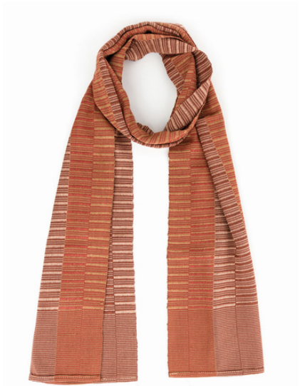
TL6-70-014 Schal aus Flüchtlingsprojekt 100% Viskose, braun, 27 x 170 cm empf. VK: 59,00 € - 69,00 €