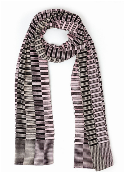
TL6-70-017 Schal aus Flüchtlingsprojekt 100% Viskose, schwarz/rosé/creme, 27 x 170 cm empf. VK: 59,00 € - 69,00 €