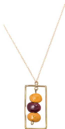
KE6-40-044 Halskette aus Projekt für Geflüchtete Keramik, recyceltes Messing, gold/rot/gelb, ca. L 80 cm, Anhänger L 4,5 cm empf. VK: 39,90 € - 47,90 €