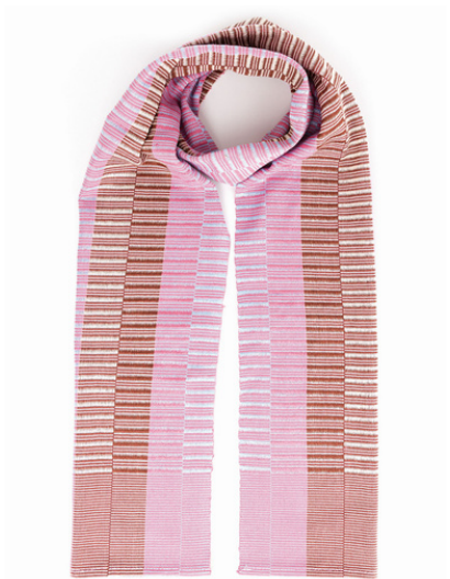
TL6-70-015 Schal aus Flüchtlingsprojekt 100% Viskose, braun/rosé/creme/blau, 27 x 170 cm empf. VK: 59,00 € - 69,00 €