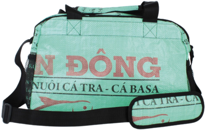
VIO-22-044 Weekender aus recycelten Reissäcken Obermaterial: 100% Polypropylen, Innenfutter: 100% Baumwolle, verschiedene Farben, 38 x 20 x 26 cm empf. VK: 39,90 € - 47,90 €