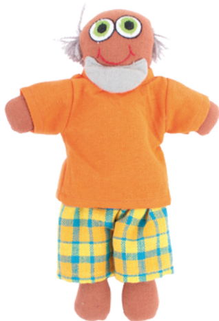
SL9-90-074 Vielfaltspuppe "Otto" 100% handgewebte Baumwolle, Füllung: 100% Polyester, 3-teilig, Anziehpuppe mit grauen Haaren, L 21 cm empf. VK: 13,90 € - 17,90 €