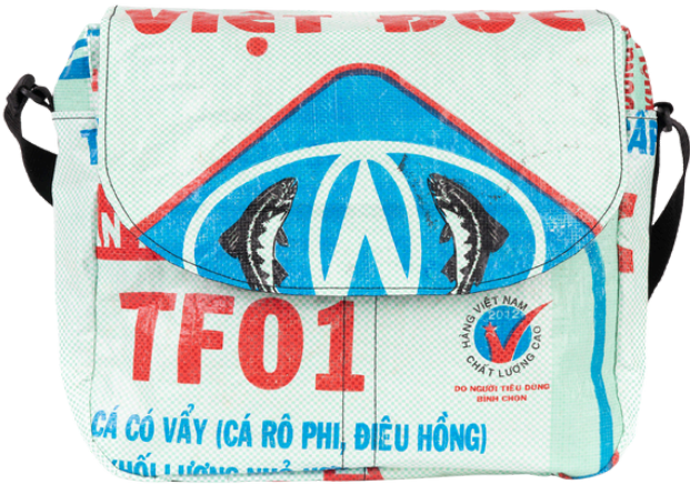
VIO-22-043 Schultertasche aus recycelten Reissäcken Obermaterial: 100% Polypropylen, Innenfutter: 100% Baumwolle, verschiedene Farben, 36 x 12 x 30 cm empf. VK: 34,90 € - 41,90 €