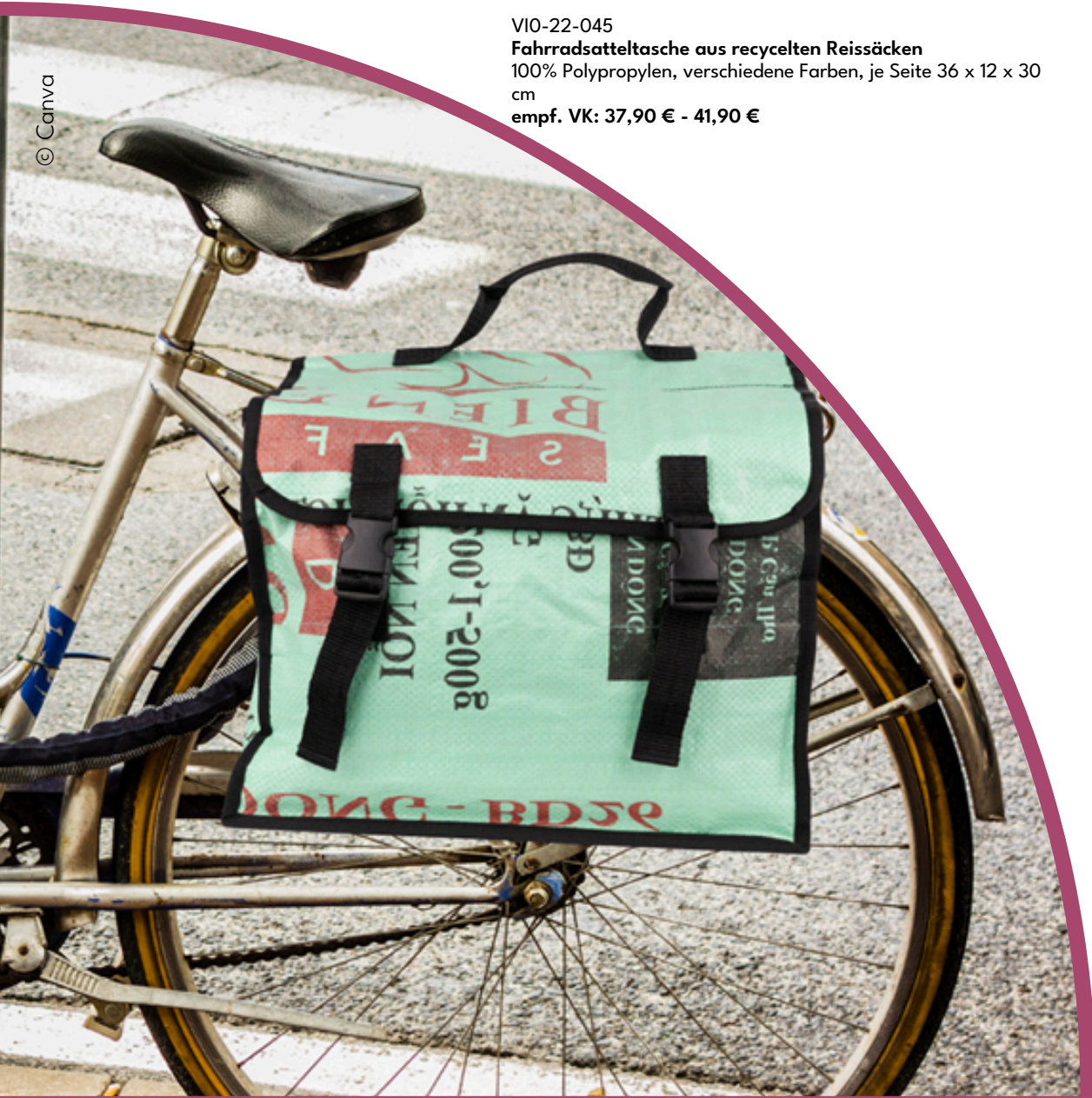
VIO-22-045 Fahrradsatteltasche aus recycelten Reissäcken 100% Polypropylen, verschiedene Farben, je Seite 36 x 12 x 30 cm empf. VK: 37,90 € - 41,90 €