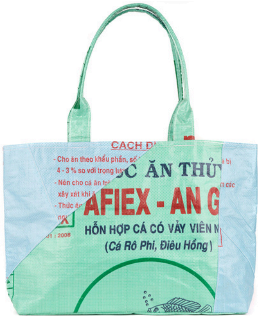
VIO-22-046 Shopper aus recycelten Reissäcken 100% Polypropylen, verschiedene Farben, 40 x 10 x 50 cm (inkl. Henkel) empf. VK: 24,90 € - 29,90 €