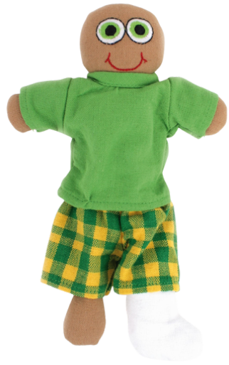
SL9-90-076 Vielfaltspuppe "Ben" 100% handgewebte Baumwolle, Füllung: 100% Polyester, 4-teilig, Anziehpuppe mit Behinderung oder Krankheit, L 23 cm empf. VK: 13,90 € - 17,90 €