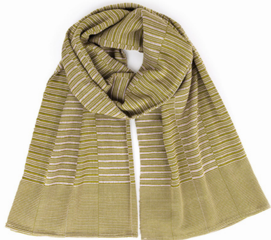
TL6-70-019 Umschlagtuch aus Flüchtlingsprojekt 100% Viskose, grün/creme, 60 x 170 cm empf. VK: 89,00 € - 109,00 €