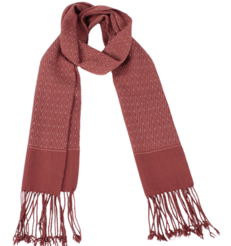
TL6-70-009 Schal aus Flüchtlingsprojekt mit Pflanzenfarben 100% Baumwolle, gefärbt, handgewebt, rosé, 20 x 160 cm empf. VK: 59,00 € - 69,00 €