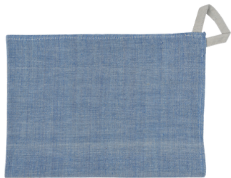
AE2-70-200 Geschirrtuch aus Projekt für Geflüchtete 70% handgewebte Baumwolle aus kbA, 30% Viskose, blau/grau meliert, 45 x 60 cm empf. VK: 9,90 € - 12,90 €