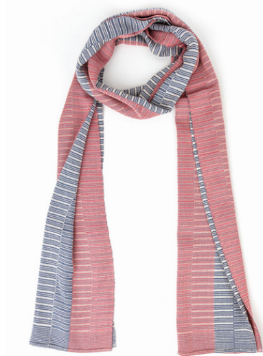
TL6-70-016 Schal aus Flüchtlingsprojekt 100% Viskose, rosé/creme/blau, 27 x 170 cm empf. VK: 59,00 € - 69,00 €