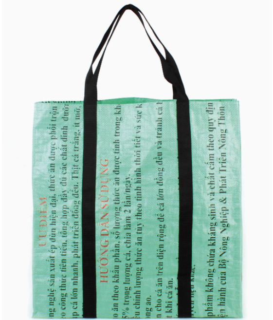
VIO-22-047 Große Einkaufstasche aus recycelten Reissäcken 100% Polypropylen, verschiedene Farben, 46 x 18 x 48 cm empf. VK: 19,90 € - 24,90 €