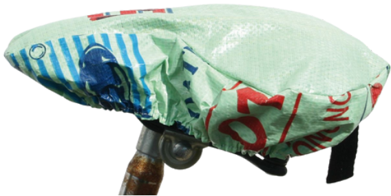
VIO-22-034 Fahrradsattelüberzug aus recycelten Reissäcken Obermaterial: 100% Polypropylen, Innenfutter: 100% Polyester, 29 x 26 cm empf. VK: 6,90 € - 8,90 €