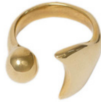
KE6-40-016 Ring recyceltes Messing, goldfarben, offen empf. VK: 27,90 € - 33,90 €