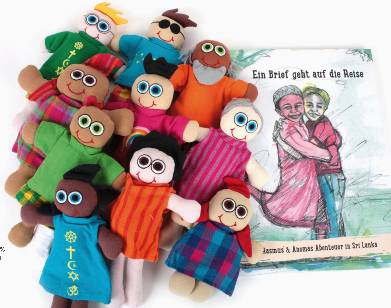
SL9-90-999 Vielfaltspuppen-Set 10 Anziehpuppen mit verschiedenen Eigenschaften aus 100% handgewebter Baumwolle, Füllung: 100% Polyester, 11-teilig mit gratis Buch empf. VK: 129,00 € - 149,00 €