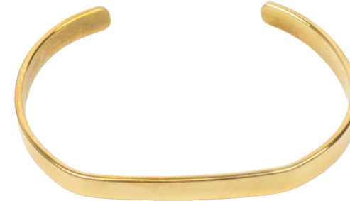
KE6-40-032 Armreif recyceltes Messing, offen, ca. Ø 6 cm empf. VK: 32,90 € - 39,90 €