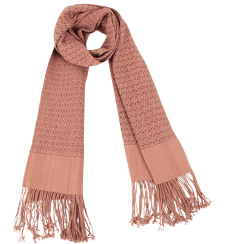
TL6-70-005 Schal aus Flüchtlingsprojekt mit Pflanzenfarben 100% Baumwolle, gefärbt, handgewebt, sand/braun, 40 x 180 cm empf. VK: 79,00 € - 95,00 €