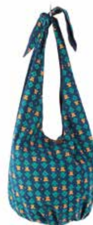
in3-20-167 Slingbag 100% Baumwolle, mit Kalamkari-Druck, blau, L ca. 80 cm 29,90 €