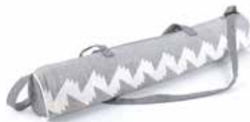
ne2-20-055 Tasche für Yoga-Matte 100% handgewebte Baumwolle, grau/weiß, 65 x 13 cm 15,90 €