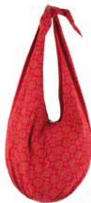
in3-20-166 Slingbag 100% Baumwolle, mit Kalamkari-Druck, rot, L ca. 80 cm 29,90 €