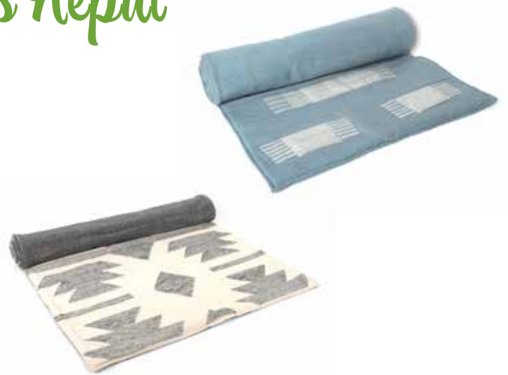
ne2-20-054 Yoga-Matte 100% handgewebte Baumwolle, grau/weiß, 60 x 170 cm 49,00 €