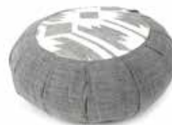
ne2-20-056 Yoga-Kissen mit Baumwollfüllung 100% handgewebte Baumwolle, Bezug abnehmbar, grau/weiß, 40 x 20 cm 39,90 €