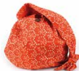
in3-20-159 Slingbag 100% Baumwolle, mit Kalamkari-Druck und Perlenstickerei, orange, L ca. 80 cm 29,90 €