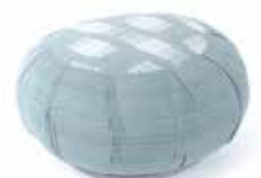
ne2-20-062 Yoga-Kissen mit Baumwollfüllung 100% handgewebte Baumwolle, Bezug abnehmbar, blau/weiß, 40 x 20 cm 39,90 €