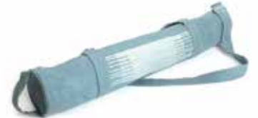
ne2-20-061 Tasche für Yoga-Matte 100% handgewebte Baumwolle, blau/weiß, 65 x 17 cm 15,90 €