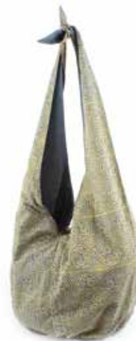
in3-20-160 Slingbag 100% Baumwolle, mit Kalamkari-Druck und Perlenstickerei, grau/gelb, L ca. 80 cm 29,90 €