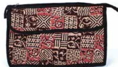
in2-20-733 Kulturbeutel 100% Baumwolle, Kalamkari-Druck, beige/rosa/schwarz, 30 x 9 x 19 cm 14,90 €