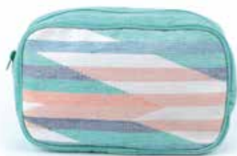
ne2-20-006 Kulturbeutel 100 % Baumwolle, türkis/weiß/rosa, 27 x 7 x 18 cm 14,90 €