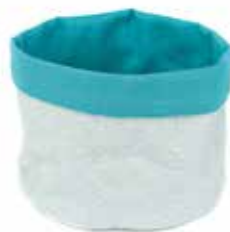
in3-20-201 Wende-Utensilo „Ocean Breeze“ 100 % Baumwolle, mint/türkis, H 12,5 cm, Durchmesser 17 cm 11,90 €