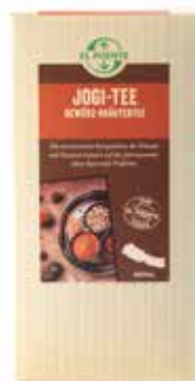
ne0-12-112 Jogi Tee Gewürz-Kräutertee, 150 g 6,90 €