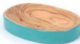
pl3-20-011 Seifenschale „Splash“ Olivenholz, natur/türkis, 11,5 x 8 cm 19,90 €

Mit den Utensilios, Kosmetiktaschen und Seifenschalen kommt eine frische Meeresbrise ins Bad. Ein Hingucker bei der morgendlichen Badroutine. Die Badaccessoires sind aus natürlichen Materialien gefertigt wie Baumwolle oder Holz. Hergestellt werden sie von unseren Handelspartnern aus Indien, Nepal und Palästina.