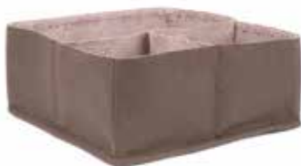
in3-20-213 Bad-Organizer „Earth & Stone“ mit 3 Innenfächern, 100% Baumwolle, taupe/graubraun, 20,5 x 20,5 cm 24,90 €