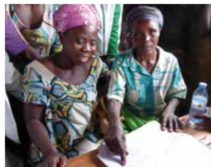
Die Kooperative Muungano legt viel Wert auf die Förderung von Frauen.

Über Konfessions- und Ländergrenzen hinweg engagieren sich christliche Frauen in der Bewegung des Weltgebetstags. Ab sofort bietet El Puente in Kooperation mit dem Weltgebetstags-Komitee einen eigenen Kaffee für diesen Anlass an. Angebaut in der Demokratischen Republik Kongo ist der bio-faire Kaffee ein Botschafter starker Frauen. Für jedes Kilo Weltgebetstags-Kaffee geht 1 € an die Projekte des Deutschen Weltgebetstags-Komitees. Und natürlich kommt der Verkauf des Kaffees den Kleinbäuer*innen der Kooperative „Muungano“ zu Gute. „Muungano“ heißt „Miteinander“ in Suaheli. Durch den Anbau von Bio-Kaffee bringt die Kooperative Menschen in der Demokratischen Republik Kongo zusammen, die durch den Bürgerkrieg getrennt wurden. Ein Ziel dabei ist es, Frauen zu stärken und Gleichberechtigung